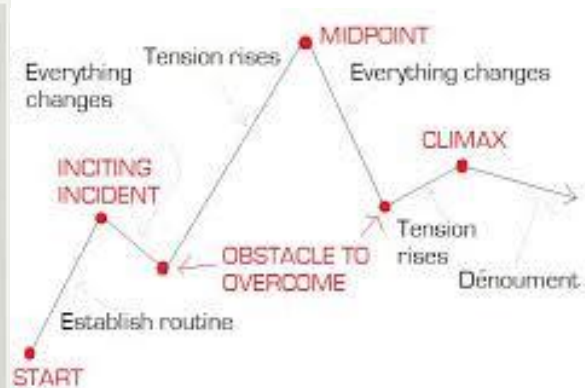
THE STORY ARC